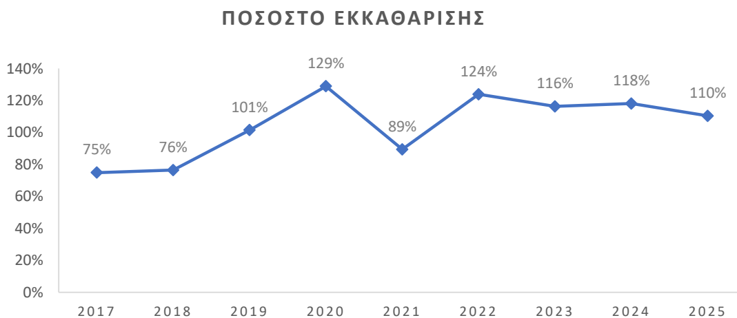
Διάγραμμα 1. Ποσοστό εκκαθάρισης υποθέσεων οικογενειακών διαφορών και διατροφών ανά έτος

Ο Πίνακας 2 αποτυπώνει την εξέλιξη του ποσοστού εκκαθάρισης και του χρόνου εκδίκασης των υποθέσεων οικογενειακών διαφορών και διατροφών ανά βαθμό δικαιοδοσίας κατά τα έτη 2017-2025.